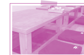
天然木を利用した掘りごたつ式の座敷。 ゆったりとくつろげる空間です。

地ざかな屋ダイニング 熊本市九品寺1丁目9-12 ドムス九品寺1F tel.096-371-8883