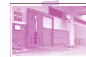
白壁が印象的なエントランス。 木目と合わせ落ち着きを演出しています。

外観は白壁をベースにシンプルにモダンな印象に。 内装は天然木をふんだんに使用しています。くつろ げる掘りごたつ式の座敷と一枚板のカウンター。さ らに今回多用途なテーブル席を拡張し、さらにさま ざまなシーンに合うお店となりました。機会があり ましたら、ぜひお店にお立ち寄りください。