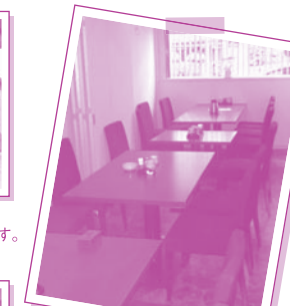
今回新しく拡張したテーブル席。 自由度が高いつくりとしました。